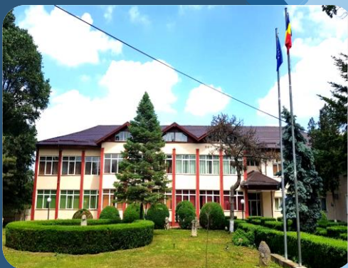
ȘCOALA GIMNAZIALĂ NR.3 SLOBOZIA